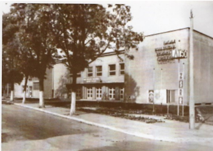
Czeladź – Piaski (obecnie ul. Trznadla)