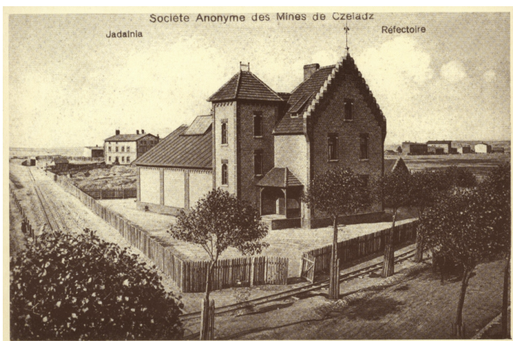
Jadalnia dla pracowników kopalni "Czeladź", późniejsza siedziba Polskiego Towarzystwa Gimnastycznego "Sokół" Gniazdo Piaski. I połowa XX w.

W miejscu obecnej siedziby Kopalni Kultury pierwotnie znajdował się budynek wzniesiony w 1912 r. specjalnie z przeznaczeniem na jadalnię dla pracowników kopalni „Czeladź”.